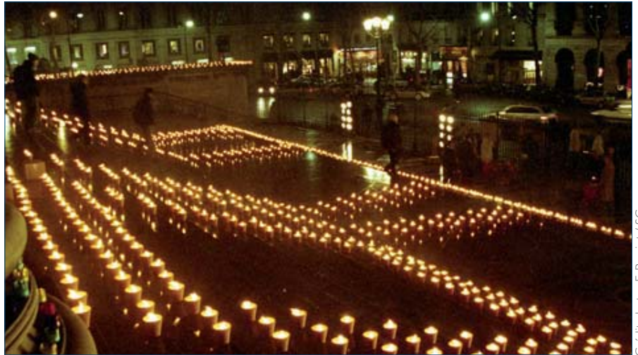
De nombreuses entreprises participent chaque année à la campagne 10 millions d'étoiles

Mais aussi, depuis peu, c'est une fantas-tique mobilisation des grandes tables