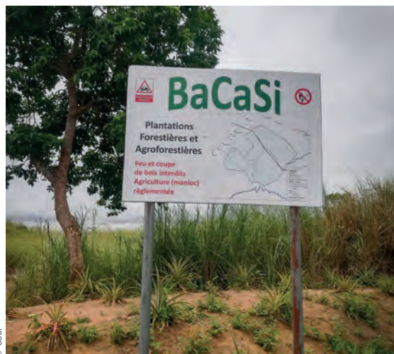
Carteles instalados en la zona del proyecto, foto tomada durante una visita al lugar.

Propietario de tierras, Ngo, 19 de marzo de 2023.