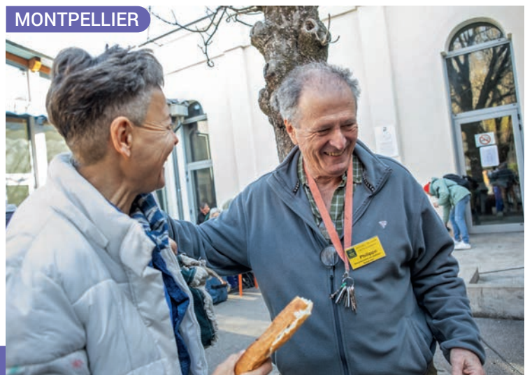
Christophe Hargoues / SCSF