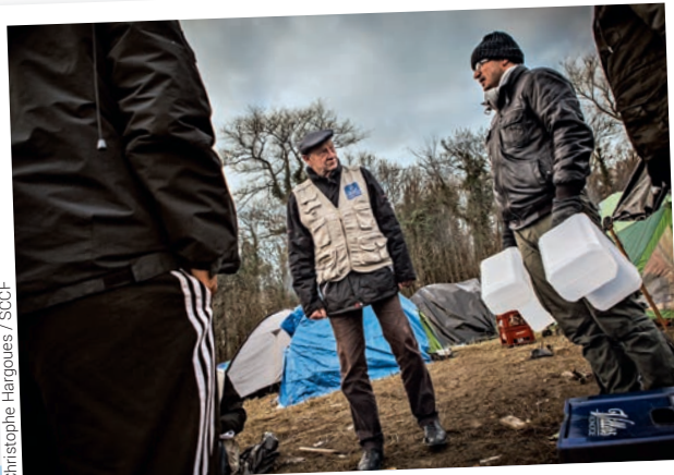
Christophe Hargoues / SCCF

Le Secours Catholique crée CoRe, une Communauté résiliente réunissant 23 partenaires issus de 18 pays situés sur les cinq continents et qui vise à promouvoir une transition écologique juste.