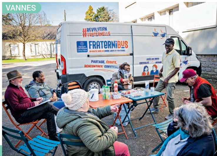
Vincent Boisoit / SCCF