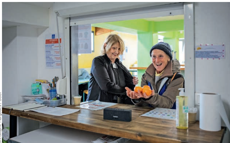
Christophe Hargoues / SCCF

Hébergée de temps à autre chez son fils, Aïcha, la soixantaine, est venue prendre une douche. « Je passe ma matinée à discuter avec tout le monde », dit-elle. À ses côtés, Joëlle, bénévole, ne cherche pas autre chose : « J'aime les gens ! Parler avec eux. Je pratique l'humour aussi. » S'engager a été sa bouée de sauvetage contre une solitude sévère, alors elle tient à faire savoir autour d'elle combien sont importantes la participation de tous et l'émancipation des plus fragiles. « On est tous égaux ! »