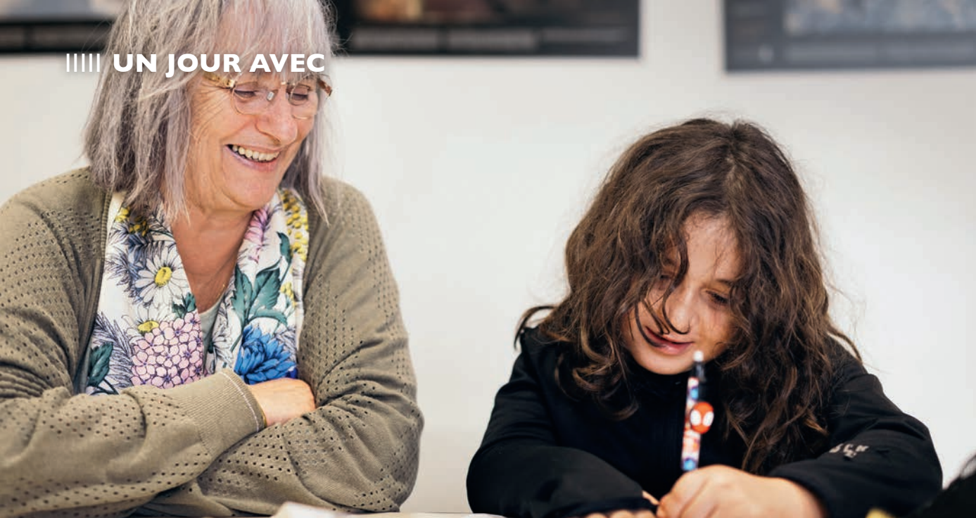
Anthony Micallef / SCCF