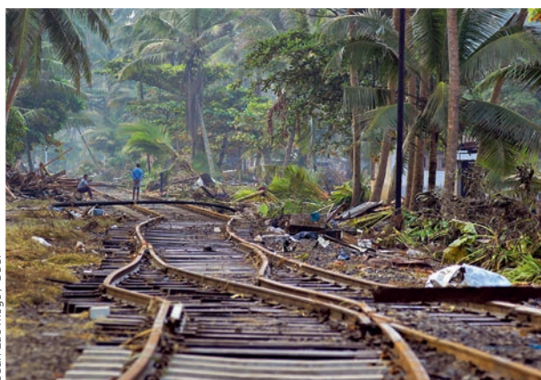
Jean-Luc Mège / SCCF

Année d'élection présidentielle, le Secours Catholique organise un "Tour de France des préjugés" pour sensibiliser aux réalités de la précarité.