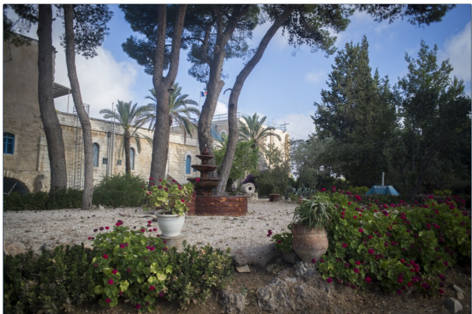
La belleza de un lugar propicio a la meditación