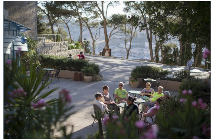
Un lugar de intercambios y encuentros