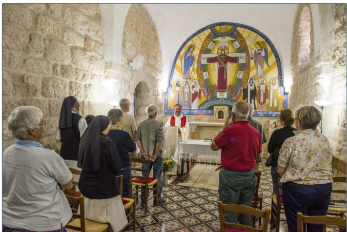
Lugares de oración y celebraciones

Sin olvidar las comodidades de un alojamiento de calidad