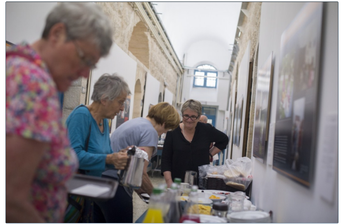
Un equipo dedicado, compuesto en parte de voluntarios