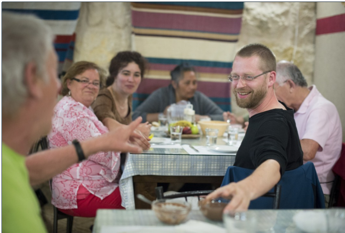
Un ambiente familiar