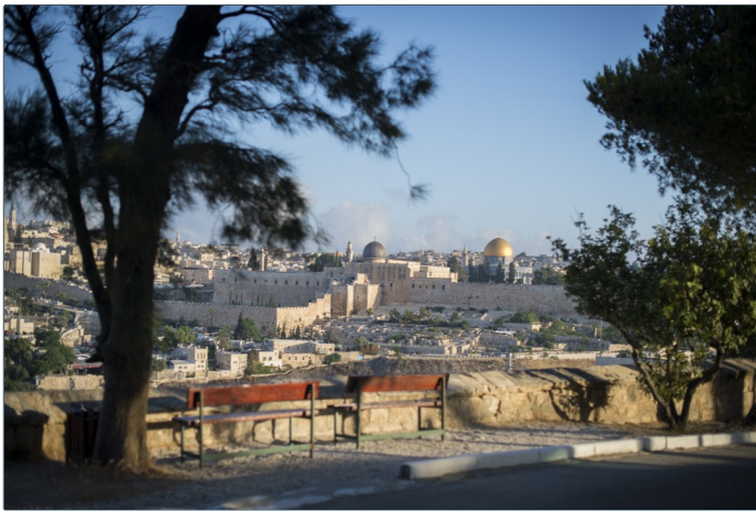
Una de las vistas más hermosas de Jerusalén